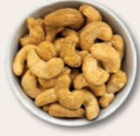
GOLDGRÄBER Ofengeröstete Cashewkerne mit Curry Bei der fettarmen Röstung wird ein feiner Currymantel um die Kerne gelegt.