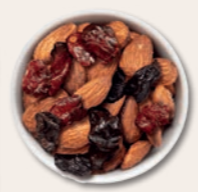
GAMECHANGER Salzmandeln, Cranberries und Weinbeeren Lassen Sie sich inspirieren von einer ungewöhnlich guten Kombination aus Weinbeeren, Cranberries und salzig-rauchigen Mandeln.