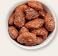
GEBRANNTE MANDELN MIT EINEM HAUCH ZIMT Der leichte Karamellduft versetzt Genießer direkt auf den Weihnachtsmarkt.