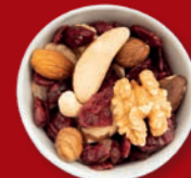
Edelnüsse & Cranberries