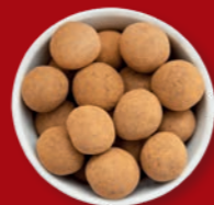
Haselnusskerne mit Vollmilch & Zimt