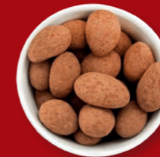
Trüffelmandeln mit Kakao