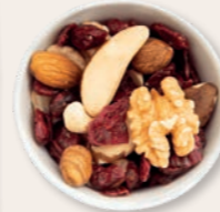
EDELNÜSSE UND CRANBERRIES Süßliche Cashews, herbe Mandeln und aromatische Walnüsse spielen mit der leichten Säure schonend getrockneter Cranberries.