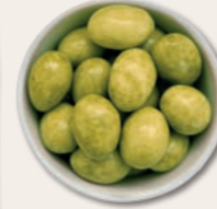
ENTSCHEIDUNGSHELFER Mandeln mit grünem Matcha-Tee und weißer Schokolade Der herbe Matcha harmoniert perfekt mit der Süße weißer Schokolade und der leicht bitteren Mandelnote.