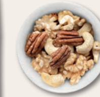
BRAINSTORMER Cashewkerne, Walnusskerne & Pekannusskerne Herbe Walnüsse, süßliche Cashewkerne und edle Pekannusskerne in ihrer reinsten Form ergeben ein knackiges Genusstrio.