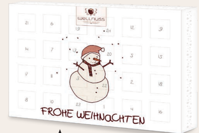
PREMIUM ADVENTSKALENDER ab 500 Stück vollflächig bedruckt Mehr Infos ab Seite 6