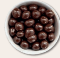
WACHMACHER Kaffeebohnen in Zartbitterschokolade Die Schokoladenschicht ist gerade so dick, dass sie gegen das Kaffee Aroma besteht, es jedoch nicht erdrückt oder verfälscht.