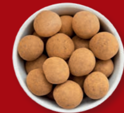
Haselnusskerne mit Vollmilch & Zimt