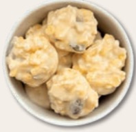
SEELENMASSEUR Schoko-Crispies mit weißer Schokolade Weiße Schokolade, Kürbiskerne, Cornflakes und Erdbeerstückchen – Balsam für die Seele.