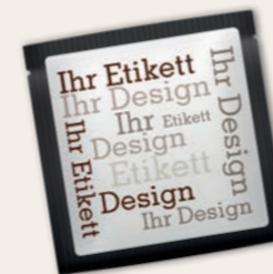
GOURMET GEWÜRZ IM PORTIONSBEUTEL ab 500 Stück mit Ihrem Etikett ab 5.000 Stück mit vollflächig bedruckter Folie Mehr Infos ab Seite 28