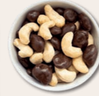
AKKULADER Cranberries in Zartbitterschokolade und Cashewkerne Doppelte Geschmackspower Zartbitterschokolade für die Seele, Cashewkerne für den Crunch.