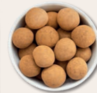
GLÜCKSKUGEL Haselnusskerne mit Vollmilchschokolade und Zimt Über knackige Haselnüsse spannt sich ein Mantel aus belgischer Schokolade, bestäubt mit feinstem Zimt.