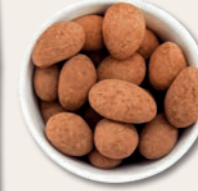
GLÜCKSBRINGER Trüffelmandeln mit Kakao Ein Mandelkern, umhüllt von feinsten belgischer Schokolade, bedeckt mit einem Hauch Kakaopulver.