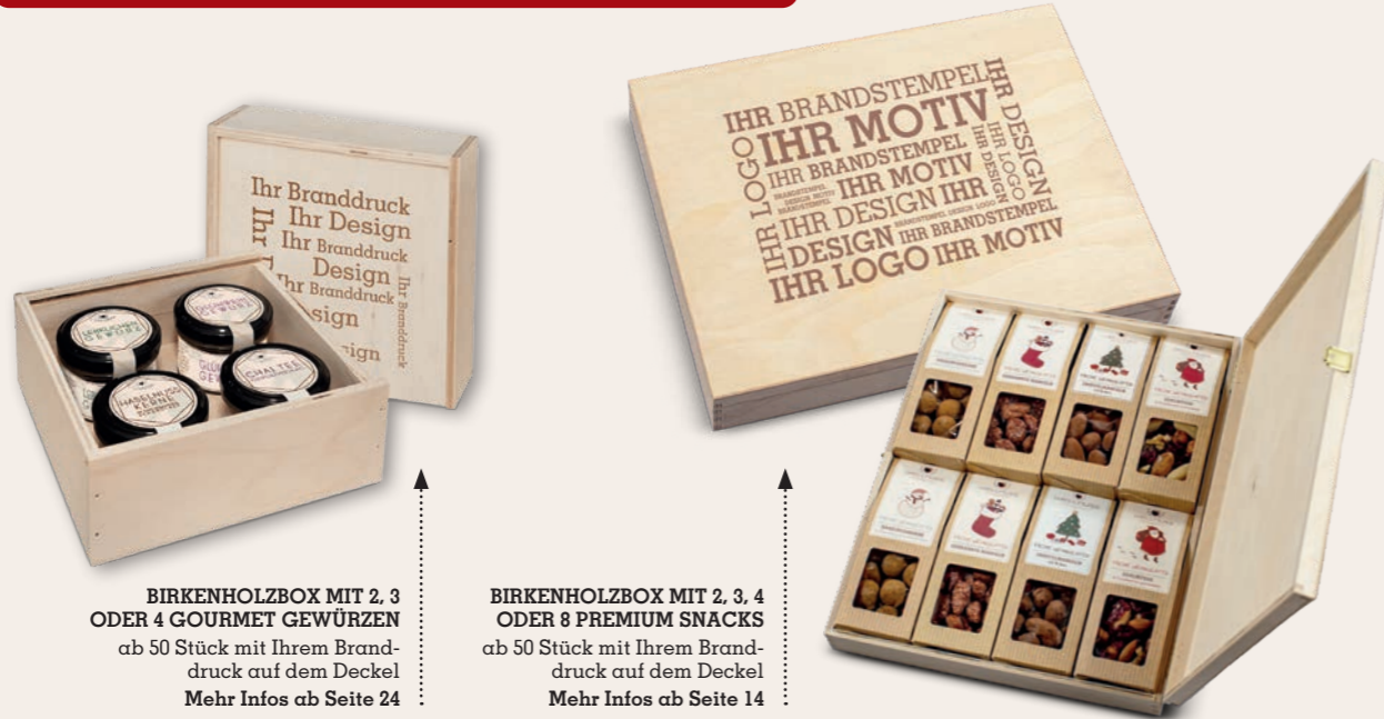
BIRKENHOLZBOX MIT 2, 3 ODER 4 GOURMET GEWÜRZEN ab 50 Stück mit Ihrem Branddruck auf dem Deckel Mehr Infos ab Seite 24