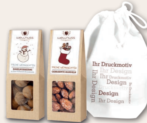
BAUMWOLLSÄCKCHEN MIT 1, 2 ODER 3 PREMIUM SNACKS ab 100 Stück mit Ihrem Druckmotiv auf dem Säckchen Mehr Infos ab Seite 12