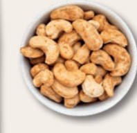
GEDANKENORDNER Ofengeröstete Cashewkerne mit Chili Bei der fettarmen Röstung wird ein feiner Chilimantel um die Kerne gelegt.