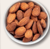
SCHORNSTEINFEGER Ofengeröstete Mandeln mit leichter Rauchnote Diese Mandel wird mit einer Prise geräucherter Salz veredelt.