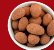
Trüffelmandeln mit Kakao