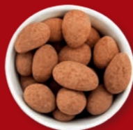
Trüffelmandeln mit Kakao