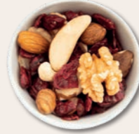
ENERGIESPENDER Edelnüsse und Cranberries Süßliche Cashews, herbe Mandeln und aromatische Walnüsse spielen mit der leichten Säure schonend getrockneter Cranberries.