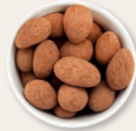
TRÜFFELMANDELN MIT KAKAO Ein Mandelkern, umhüllt von feinsten belgischer Schokolade, bedeckt mit einem Hauch Kakaopulver.